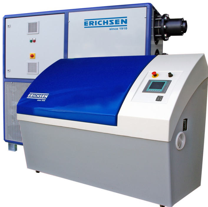
Modèle 618/400 I avec armoie compacte-conditionneur d'air PLUS

Chambre de corrosion avec interface de raccordement pour armoie compacte- conditionneur d'air