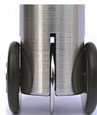
Tête d'essai à roues «435» avec disque d'essai