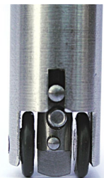
Tête de test à roues «435 S» avec outil de test