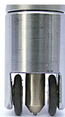
Tête d'essai à roues «318 S» avec pointe d'essai